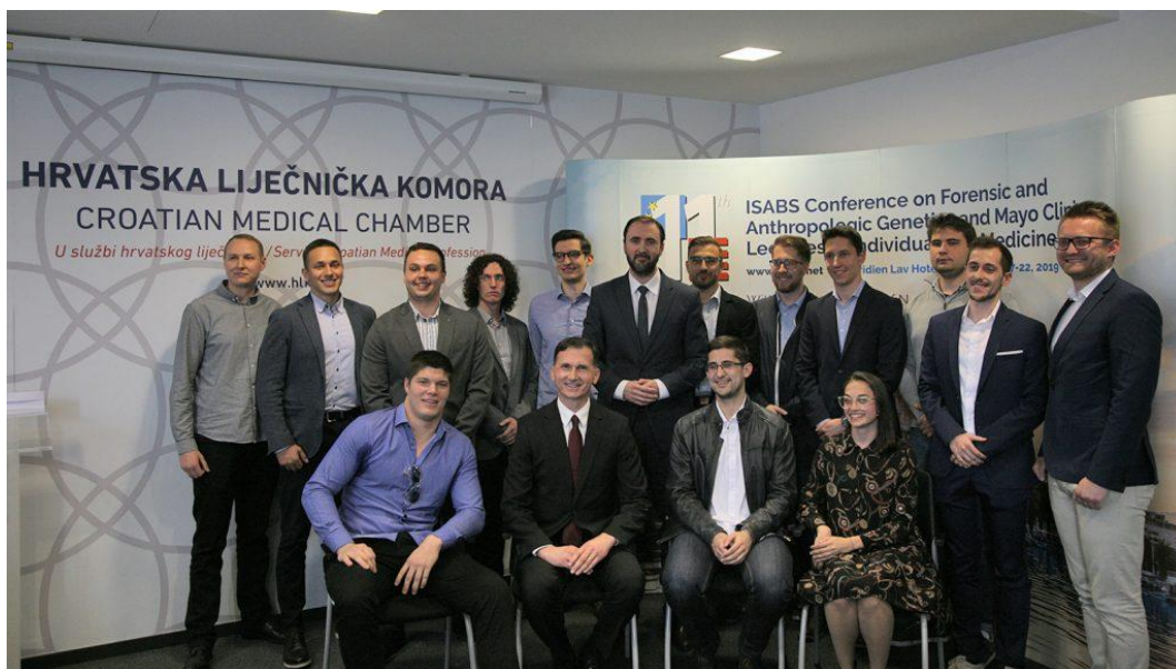
Estudiantes croatas invitados a participar en la conferencia

Zagreb, 4 de mayo de 2019 - Más de 20 de los mejores estudiantes de medicina de las universidades croatas han sido seleccionados para participar en la "11ª Conferencia ISABS sobre Genética Forense y Antropológica y Conferencias de la Clínica Mayo en Medicina Individualizada", que tendrá lugar en Split, Croacia del 17 al 22 de junio de 2019.