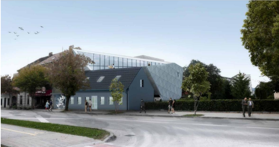
Centro Experimental Nikola Tesla (Pop-Art / Real Group)

Un nuevo centro dedicado a Nikola Tesla abrirá en Karlovac, la ciudad donde el genio inventor estudió y recibió su último diploma formal. Nacida en la aldea croata de Smiljan, Tesla se mudó a la ciudad de Karlovac a la edad de 14 años para asistir a la escuela secundaria en el Gymnasium Higher Real.