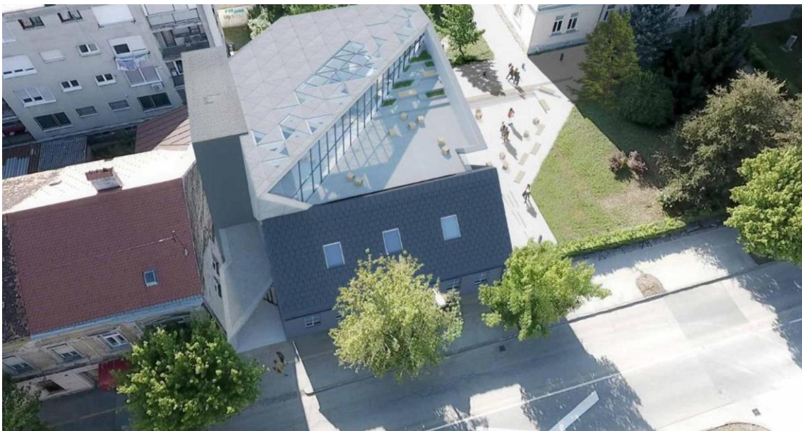
Centro Experimental Nikola Tesla (Pop-Art / Real Group)

Una inversión de 2 millones de euros en un edificio en ruinas junto a la antigua escuela de Tesla lo convertirá en un complejo llamado Nikola Tesla - Centro Experimental de Karlovac, informa Lokalni.hr.