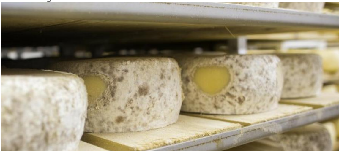
Queso Típico de Pag

Pero sin duda el oro blanco de la ciudad de Pag es la sal. Las salinas de Pag se encuentran entre las más antiguas del litoral oriental del Adriático, mencionadas por primera vez en crónicas del siglo X. La técnica tradicional de evaporación natural se abandonó con la construcción de la actual fábrica de sal, la planta de producción de sal más grande de Croacia.